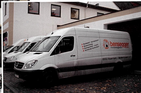
150 Jahre Firmentradiotion in Rosenheim: die Bensegger-Zentrale ...