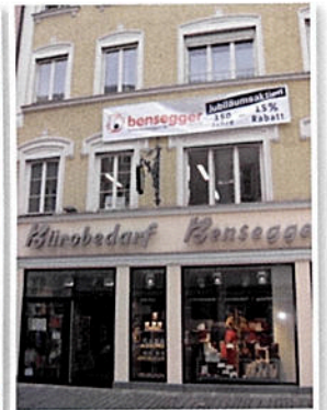
... und das Ladengeschäft in 1A-Lage in der Innenstadt