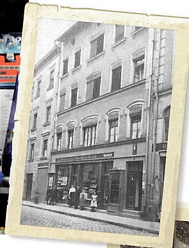
Blick zurück: das Stammhaus in der City und der Fuhrpark im Jahr 1952